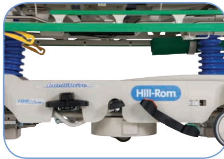
Тормоз и управление на четырех углах