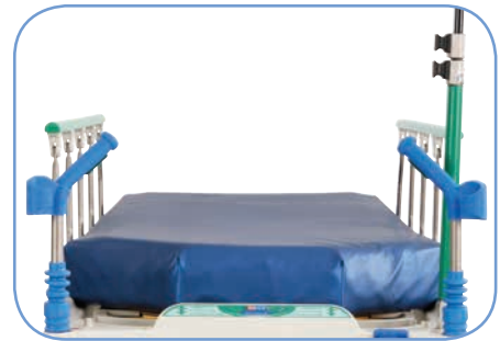
Эргономичные транспортировочные ручки и трехуровневая стационарная инфузионная стойка