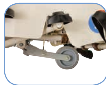
Система управления Plus Steering™ нового поколения для легкого прохождения поворотов и контроля движения