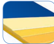
Терапевтический матрас Tempur-Pedic®