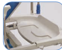
Встроенный лоток для принадлежностей