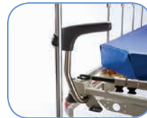
Серые эргономичные ручки с устройством для транспортировки инфузионной стойки