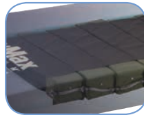
Матрас AccuMax Quantum™ VPC