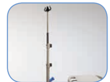
Встроенная 3-х уровневая инфузионная стойка