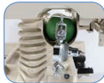
Держатель кислородного баллона