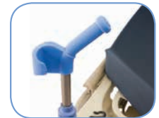
Синие эргономичные ручки с устройством для транспортировки инфузионной стойки